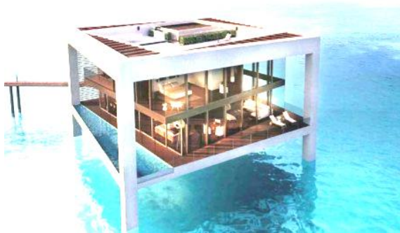
Maison sur pilotis béton