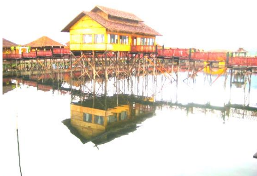
Maison sur ponts