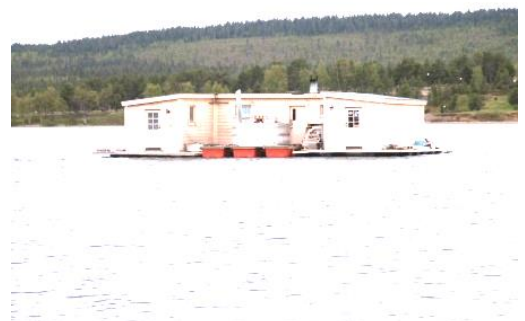
Maison sur barge