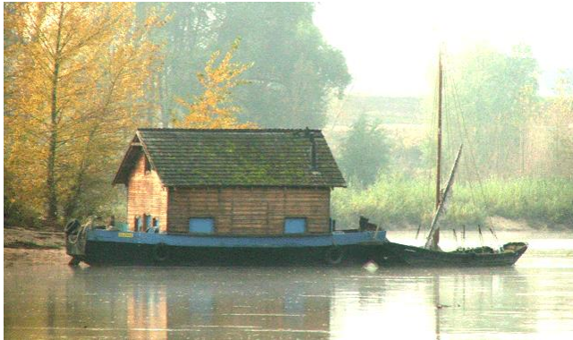
Maison sur barque

Activité : Solutions techniques pour isoler la maison de l'eau :