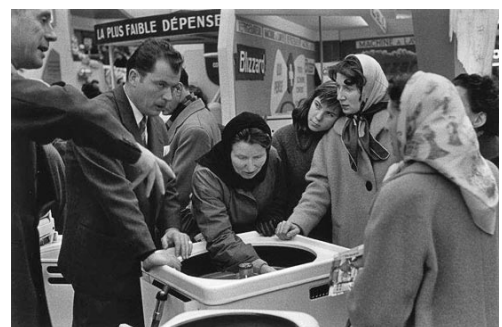
Salon des Arts Ménagers 1956 - H. Cartier Bresson

Parallèlement, la France connaît une situation de quasi-plein-emploi pendant laquelle le taux de chômage est contenu à un niveau compris entre 2% et 3% (contre environ 9,5% en 2005).