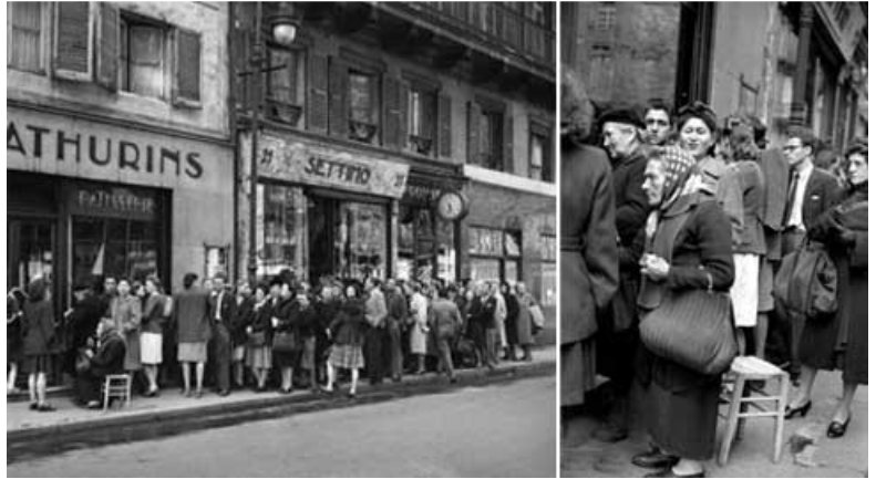
Queue devant une boulangerie en 1947 à Paris

La France ne connaît pas de réelle croissance et la vie est difficile en raison des bas salaires et du coût élevé de la vie.